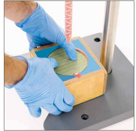
Tamponhalteplatte darauf – und fertig!

Der PMK SILICONE DISPENSER besteht aus einer Silikonkartusche mit Handhebel und Mischdüse, fixiert an einem Ständer. Mittels Handhebel wird das Silikon über die Mischdüse in die Tampon-Negativform gepresst. So wird automatisch eine Mischung im Verhältnis 1:1 garantiert. Unmittelbar nach dem Befüllen der Tamponform wird die Tamponhalteplatte auf die Silikonmasse gelegt. Optimale Haftung zwischen Silikon und Tamponhalteplatte verschafft ein Primer. Nach einer Stunde kann der Tampon aus der Form genommen werden. Fertig ist ihr Silikontampon. Schon nach 24 Stunden kann mit dem Tampon gedruckt werden.