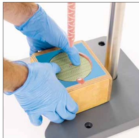
Plaque de maintien tampon – et le tour est joué !

Le doseur de silicone PMK sur pied est composé d'une cartouche en silicone avec un levier à main et une buse mélangeuse. Le silicone est pressé dans un moule négatif à l'aide du levier à main, en passant par la buse mélangeuse. Cela permet un rapport de mélange de 1:1. Un apprêt (primer) permet une adhérence maximum entre le silicone et la plaque de maintien du tampon. Le tampon est retiré du moule une heure après sa fabrication. Seulement 24 heures après sa fabrication, le tampon est utilisable en production.