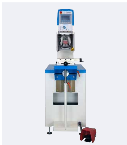
Machine de tampographie avec châssis

Les guides câbles intégrés garantissent l'installation correcte des câbles et flexibles dans le châssis. Le câble de l'interrupteur à pédale est lui aussi protégé et contribue ainsi à la sécurité au travail.