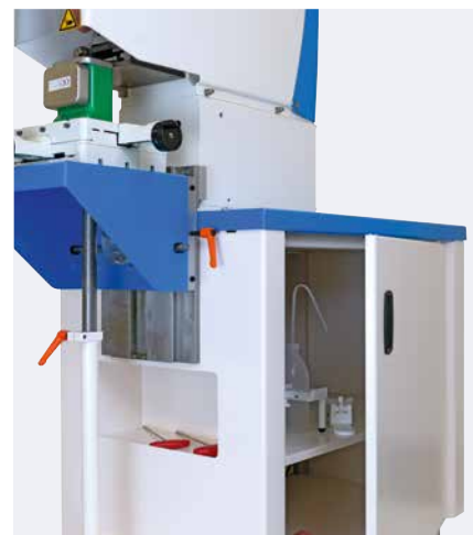
Porte-outils pratique et espace de rangement

Le châssis peut être, en option, équipé d'une table angulaire. Cette dernière permet le marquage de pièces de différentes tailles. Des tables croisées et plaques profilées peuvent également être fixés à la table angulaire. Ainsi, une utilisation polyvalente de la machine