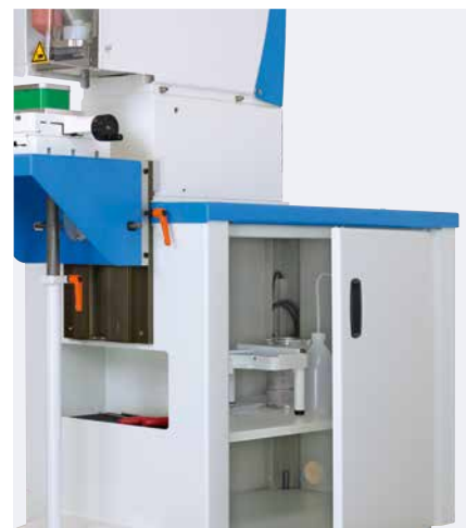
Porte-outils pratique et espace de rangement

Le châssis peut être, en option, équipé d'une table angulaire. Cette dernière permet le marquage de pièces de différentes tailles. Des tables croisées et plaques profilées peuvent également être fixés à la table angulaire. Ainsi, une utilisation polyvalente de la machine