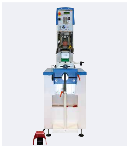
Machine de tampographie avec châssis

Les guides câbles intégrés garantissent l'installation correcte des câbles et flexibles dans le châssis. Le câble de l'interrupteur à pédale est lui aussi protégé et contribue ainsi à la sécurité au travail.