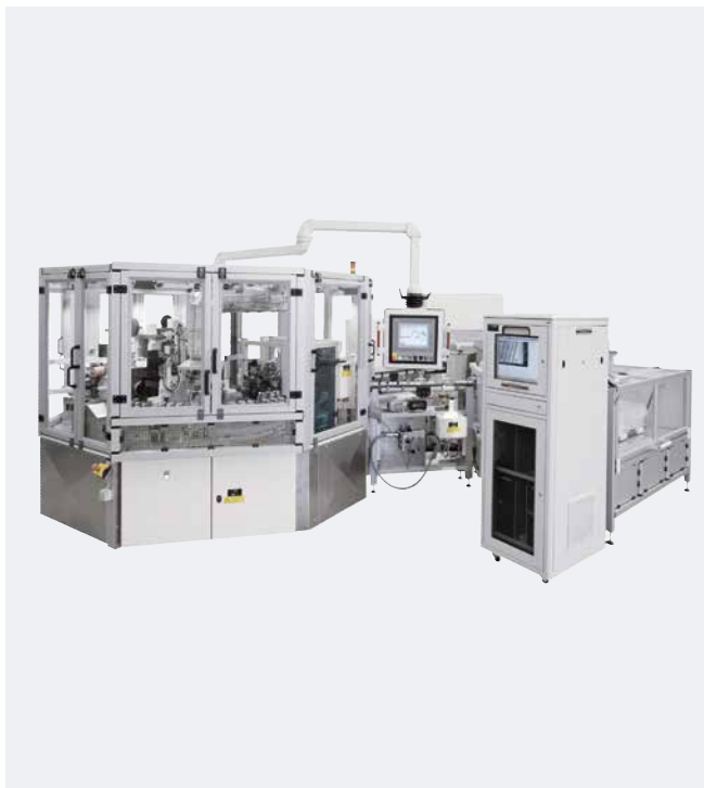
Automation Tampographie rotative Stylos à insuline

Notre construction « made in Germany » soutenue par des employés du service commercial hautement qualifiés, conduite de projet, technique ainsi que service avant et après la vente assurent à nos clients une réalisation professionnelle du concept à la production allant jusqu'à 24h.