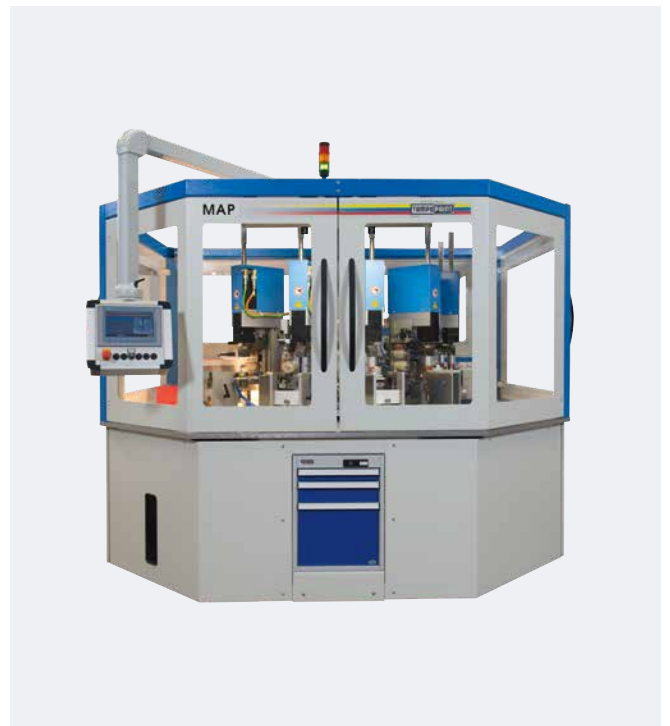
Automation MAP Plaquettes bottelpack