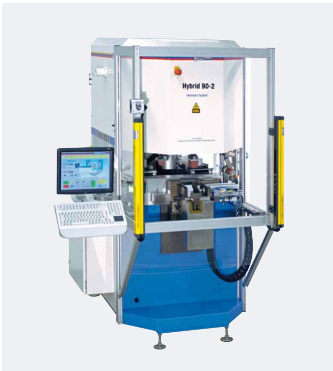
HYBRID 90-2 avec l'option barrière immatérielle Contacteur