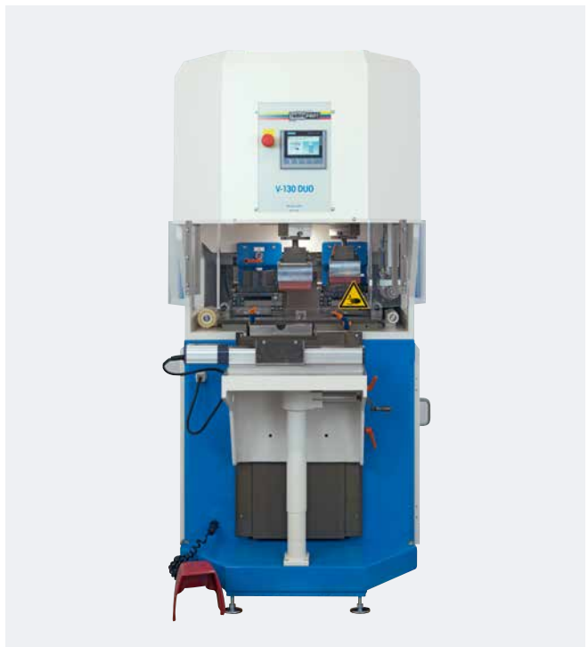
V-DUO 130/130 Matériel électrique