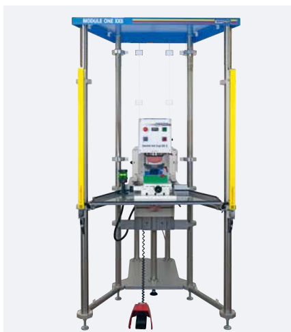
MODULE ONE XXS avec une machine de tampographie, SEALED INK CUP 90 E

La MODULE ONE XXS se compose essentiellement d'un châssis compact, d'un carter de protection et des trois éléments standard: barrière immatérielle, table angulaire et table croisée.