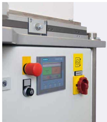
Ecran tactile pour la commande du plateau tournant

La table angulaire réglable en hauteur, associée à une surface de travail pratique, permet