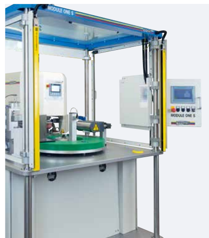
Ergonomie : Console de commande pivotante facile d'utilisation

La construction et l'assemblage ont pu être réduits grâce à la standardisation de tous les sous-ensembles et options. Seuls les posages seront fabriqués sur commande. En fonction des attentes liées à l'application, le choix est