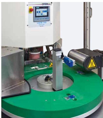
Posages multifonctions entourés d'une machine de tampographie et autres composants

La semi-automatique MODULE ONE S est utilisée pour des applications simples. Le chargement et le déchargement des pièces à marquer et marquées se font manuellement.