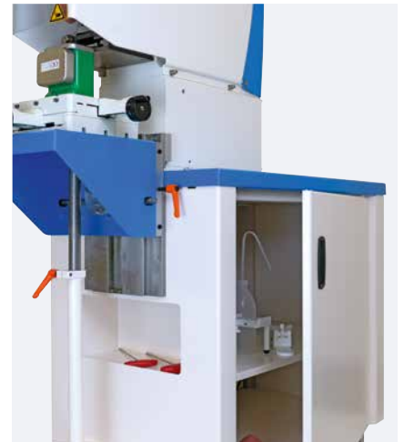
Porte-outils pratique et espace de rangement

Le châssis peut être, en option, équipé d'une table angulaire. Cette dernière permet le marquage de pièces de différentes tailles. Des tables croisées et plaques profilées peuvent également être fixés à la table angulaire. Ainsi, une utilisation polyvalente de la machine