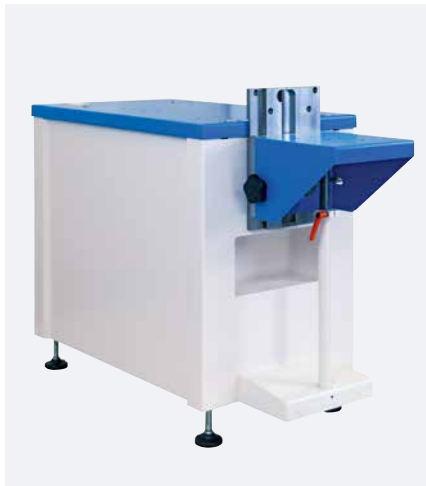
Châssis machine avec table angulaire en option

Le châssis offre une utilisation universelle pour les machines de tamponnage des séries SEALED INK CUP E et HERMETIC. Il offre un support stable et sécurisé de la machine de tamponnage lors du marquage.