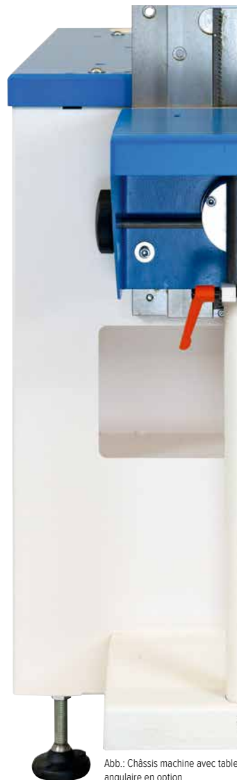
Abb.: Châssis machine avec table angulaire en option