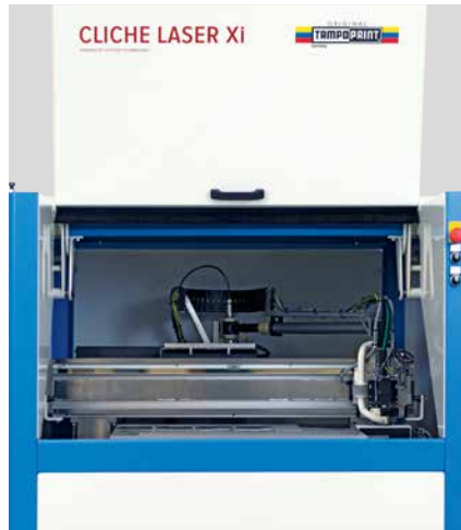
Chambre de travail

Le nombre de diodes laser installées dépend de la vitesse requise par le client. Une mise à