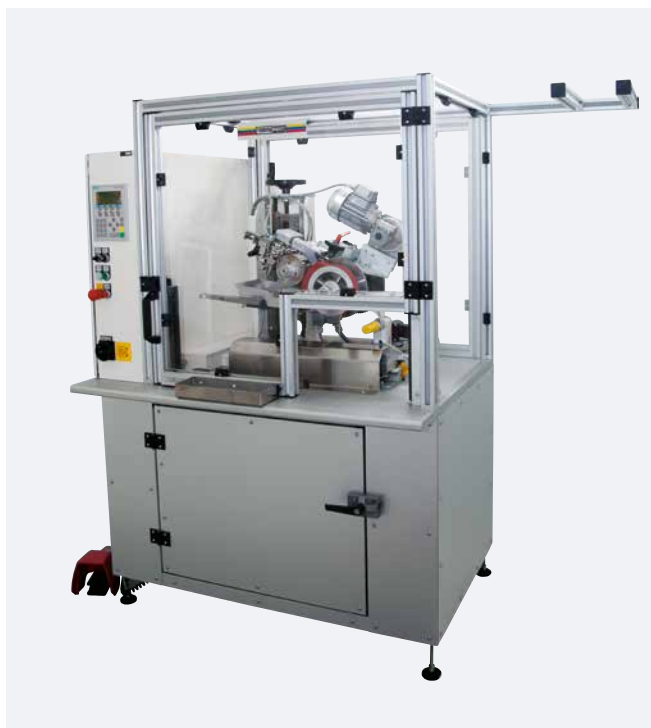
RTI COMPACT II E Fabrication spéciale (châssis fermé)