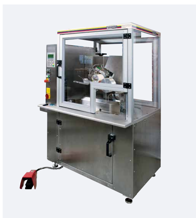
RTI COMPACT II E Fabrication spéciale (acier inoxydable)