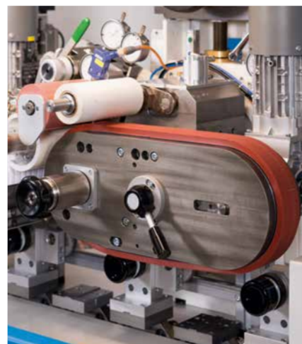
Unité d'impression avec tampon type courroie

La CONTINUOUS CIRCULAR a une capacité de 15.000 pièces/heure – selon les pièces à marquer.