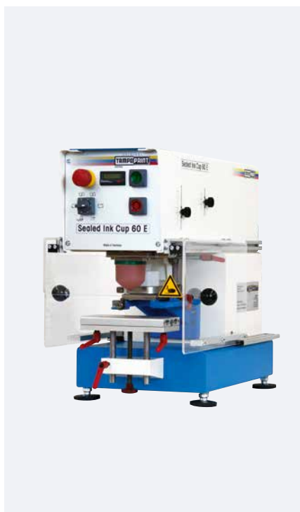
SEALED INK CUP 60 E

La série SEALED INK CUP E fait preuve d'un excellent rapport qualité/prix « made in Germany » sur le marché mondial.