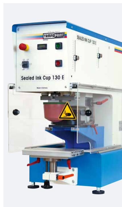
SEALED INK CUP 130 E