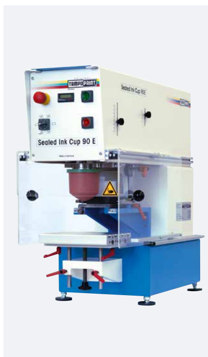
SEALED INK CUP 90 E