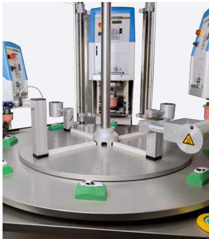
Arrangement central et clair des machines et des composants

L'élément central de la MODULE ONE M est constitué d'une plaque, sur laquelle peuvent être montés plusieurs composants de manière flexible. La MODULE ONE M peut être équipée de maximum 3 machines satellites des séries HERMETIC et SEALED INK CUP E. D'autres composants, qui peuvent être ajoutés, sont disponibles : par exemple, séchage à air froid, un sécheur infrarouge, détecteur de pièces ou un composants laser.