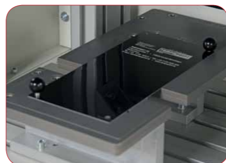
Plaque support cliché pour les tailles de cliché de fabrication TAMPOPRINT