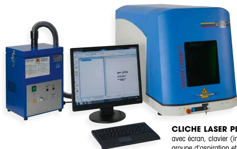
CLICHE LASER PLUS avec écran, clavier (inclus) et groupe d'aspiration et de filtration (option)