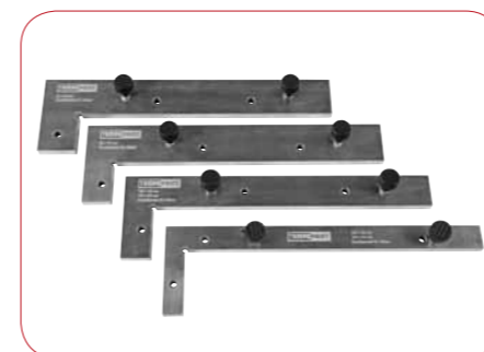
Adaptateur de format pour les modèles de clichés de fabrication étrangère (option)