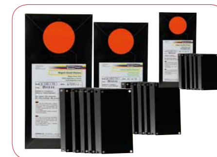
EXCLUSIVITÉ ! Clichés de tampographie adaptés à la gravure au laser

Tous les clichés aptes à la gravure au laser sont spécialement adaptés au laser avec une longueur d'ondes de 1064 nm. Entreposage illimité.