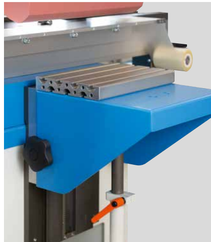
Table angulaire réglable en hauteur

L'équipement de base de cette machine de tampographie comprend un châssis de base avec un espace de rangement pratique. Ce châssis garantit également une position ferme et conduit à une grande stabilité. La flexibilité