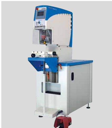
HERMETIC 60 avec un châssis de base universel, table d'angle, support transversal et pédale de commande

La série HERMETIC se démarque toujours par ses points forts bien connus : entraînement électromécanique à came, fonctionnement très silencieux, très bonne précision de position d'impression et grande précision de répétition de l'impression. De plus, la série Hermetic offre un large choix d'options d'équipement permettant la réalisation d'un grand nombre d'applications différentes.