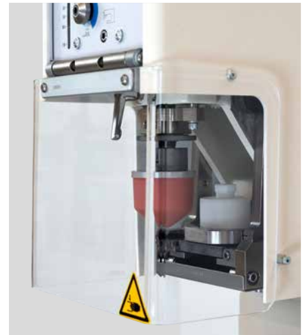
Protection frontale améliorée avec une meilleure vue d'ensemble du processus d'impression

L'option du système d'enlèvement des encres résiduelles offre une solution compacte et intelligente pendant le processus de marquage. Il est monté à l'arrière de la machine et com-