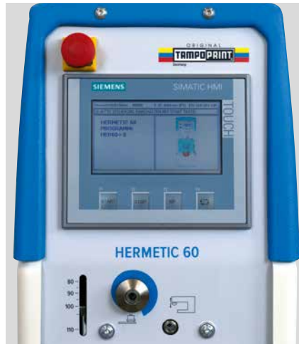
Fonctionnement moderne grâce à un écran tactile facile d'utilisation

L'unité électronique de commutation à cames qui permet un réglage précis des points d'arrêt et de signalisation dans la séquence de mouvement de la machine représente un