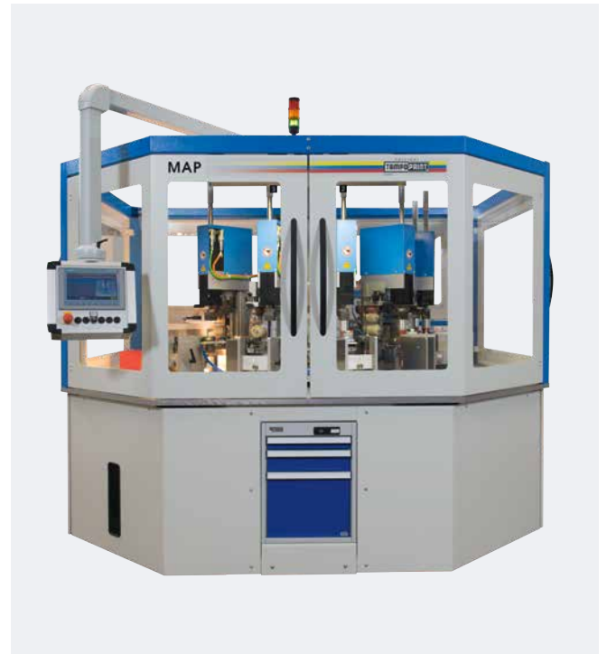
Automatización MAP Montaje variable