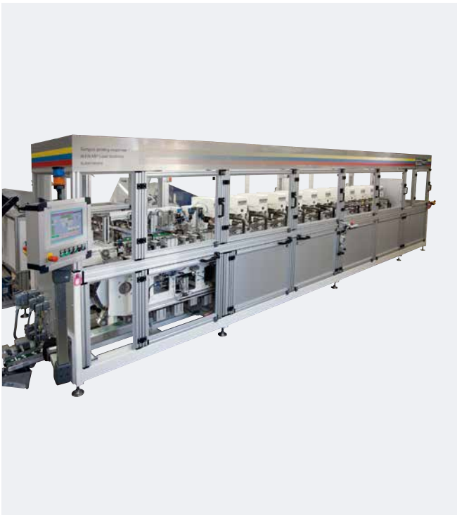
Automatización para 12 colores con RAPID 2000/1