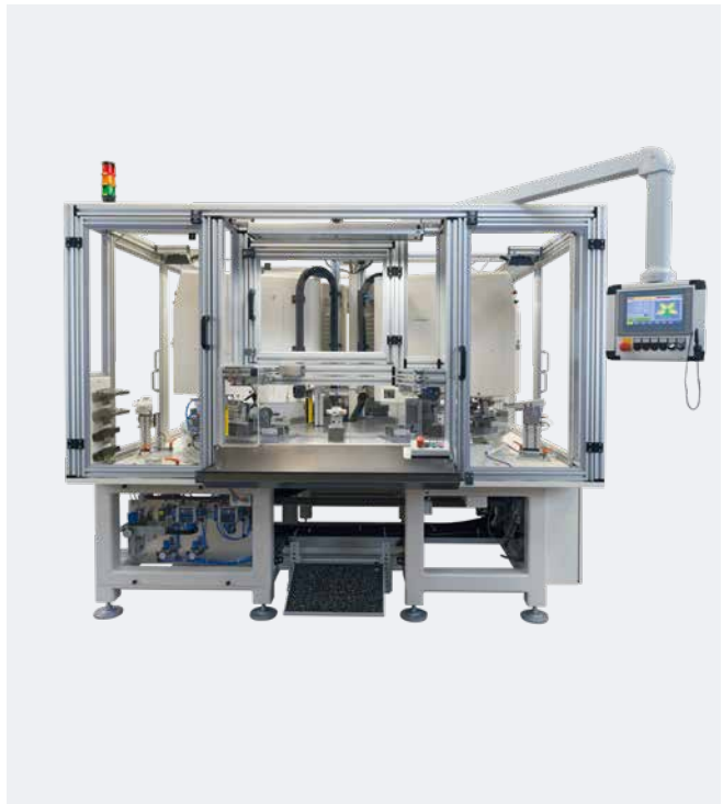
Automatización para 4 colores con HERMETIC 13-12 universal