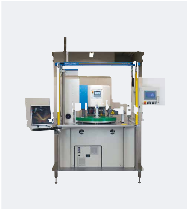
Automatización MODULE ONE S Impresión en 2 colores

Construcción de máquinas – simplemente "Made in Germany".