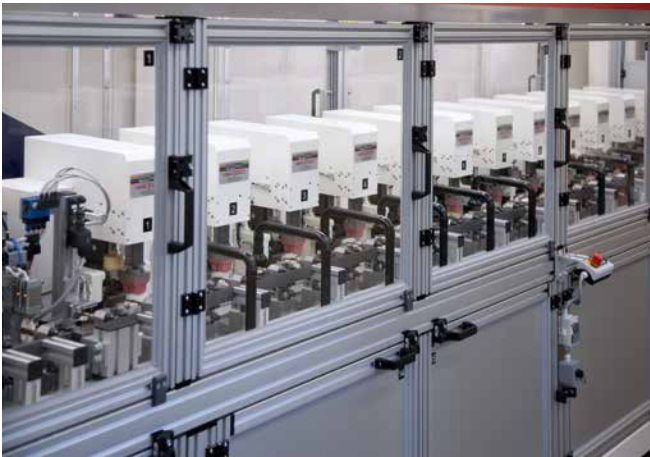
12x RAPID 2000/1 Automatización lineal