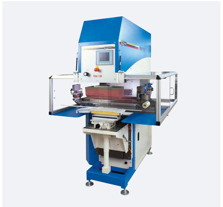
TSM 130 Kit de rascado transversal universal