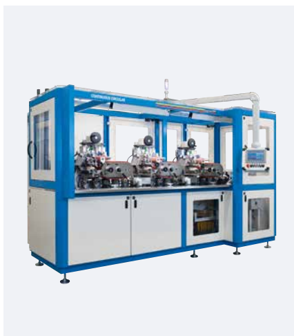
CONTINUOUS CIRCULAR con 3 unidades impresora

El CONTINUOUS CIRCULAR con su impresión circular a 360° convence gracias a su alta precisión. El proceso de impresión continuo garantiza un elevado control del proceso y, por consiguiente, una mejor calidad y una mayor precisión que en las soluciones de impresión de tapón convencionales.