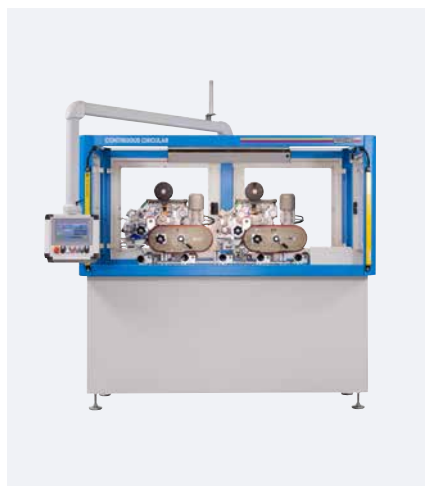
CONTINUOUS CIRCULAR con 2 unidades impresora

El CONTINUOUS CIRCULAR se puede adquirir tanto en la variante de máquina de impresión de tapón de un solo color, como de varios