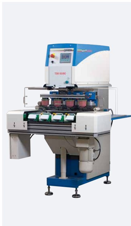
TSM 60/90 Kit multicolor Solo universal