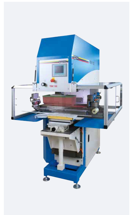
TSM 130 Kit de rascado transversal universal