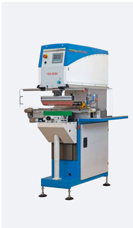
TSM 60/90 Kit de rascado transversal universal

Versiones con accionamiento servo mecánico se caracterizan por un alto número de ciclos y una gran fuerza de presión. Cinemáticas de eficiencia energética en el movimiento del rascado o del tampón y una construcción del bastidor de la máquina en modo ahorro de recursos redondean el concepto de máquina de éxito.