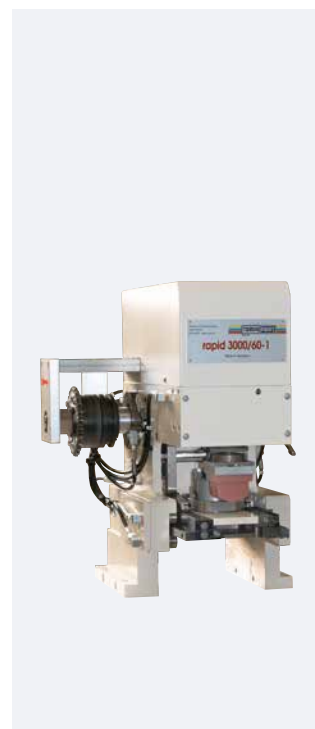
RAPID 3000/60-1 Modelo integrado para automatizaciones, accionamiento externo