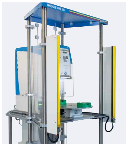
Barrera de luz, plato rotativo, mesa angular

El MODULE ONE XS se utiliza allí donde son prioritarias la seguridad y una producción