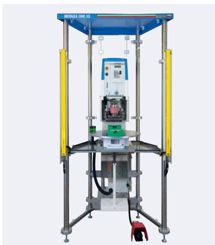
MODULE ONE XS con máquina de tampografía HERMETIC 9-12-universal

El MODULE ONE XS consta básicamente de un bastidor compacto, una carcasa protectora, así como los cuatro componentes estandarizados: plato rotativo, barrera de luz, mesa angular y soporte en cruz. La máquina de tampografía se configura de manera individual a partir de las series HERMETIC, SEALED INK CUP E y V-DUO.