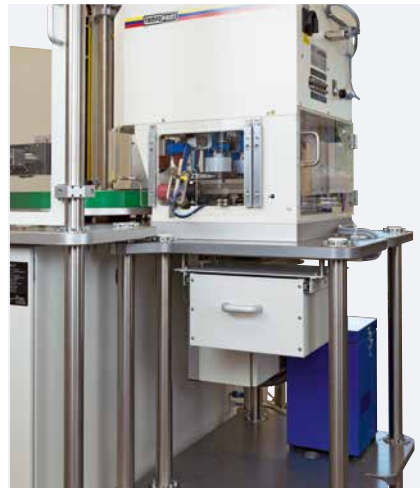
Montaje del satélite en la parte trasera de la máquina con fácil acceso a las unidades de impresión.

Con la posibilidad de realizar imágenes de impresión de cos colores hasta un tamaño