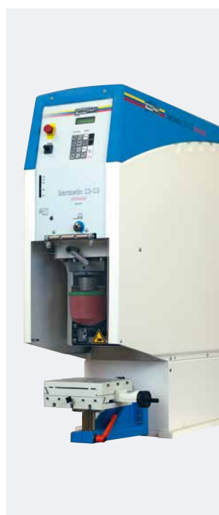
HERMETIC 13-12 universal