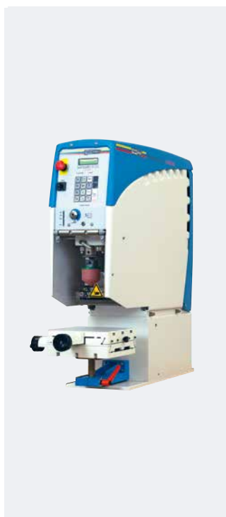
HERMETIC 6-12 universal

Además de las ventajas mencionadas, la HERMETIC 150 ofrece una medida máx. de impresión de \varnothing 140 mm. Puede instalarse un sistema limpiador de tampones (opcional) tanto a la derecha como a la izquierda de la máquina.