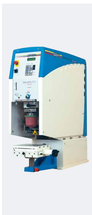
HERMETIC 9-12 universal