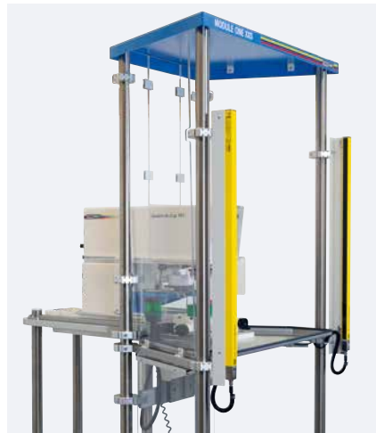
Barrera de luz

La máquina de tampografía se configura de manera individual a partir de las series HERMETIC, SEALED INK CUP E y V-DUO.