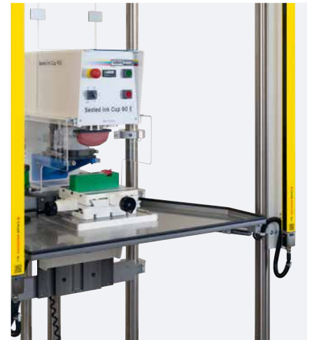
Mesa angular con bandeja

La mesa angular de altura regulable permite imprimir piezas de distintas alturas.