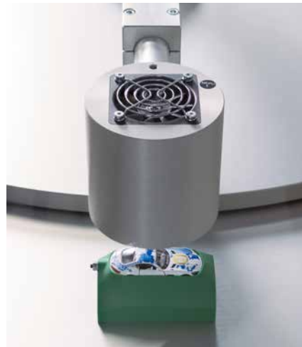
Secado por aire frío de componentes – secado sencillo de la tinta de tampografía para una impresión ulterior más rápida

es adecuada para múltiples aplicaciones, por ejemplo en los sectores de juguetería, electrónica o electrodomésticos.