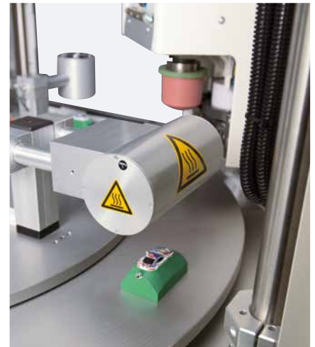
Secado de componentes por infrarrojos – reduce el tiempo de secado de la tinta de tampografía

La construcción y el montaje se han reducido gracias a la estandarización de todos los grupos constructivos y opciones adicionales. Exclusivamente los asientos de piezas son fabricados con modernas máquinas-herramienta en base al pedido.