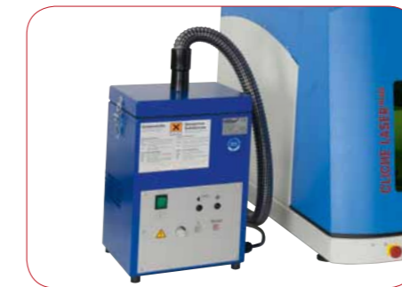
Absaug- und Filteraggregat (Option)