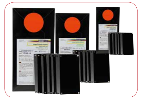
EXKLUSIV! Lasergravurfähige Tampondruckklischees

Alle lasergravurfähigen Klischees sind speziell abgestimmt auf Laser mit einer Wellenlänge von 1064 nm. Lagerung unbegrenzt.