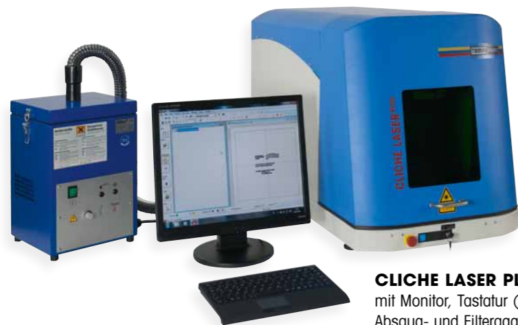
CLICHE LASER PLUS mit Monitor, Tastatur (Lieferumfang) und Absaug- und Filteraggregat (Option)