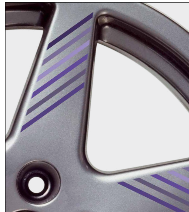
Beispiel: Mehrfarbiges Dekor (6 Farben)