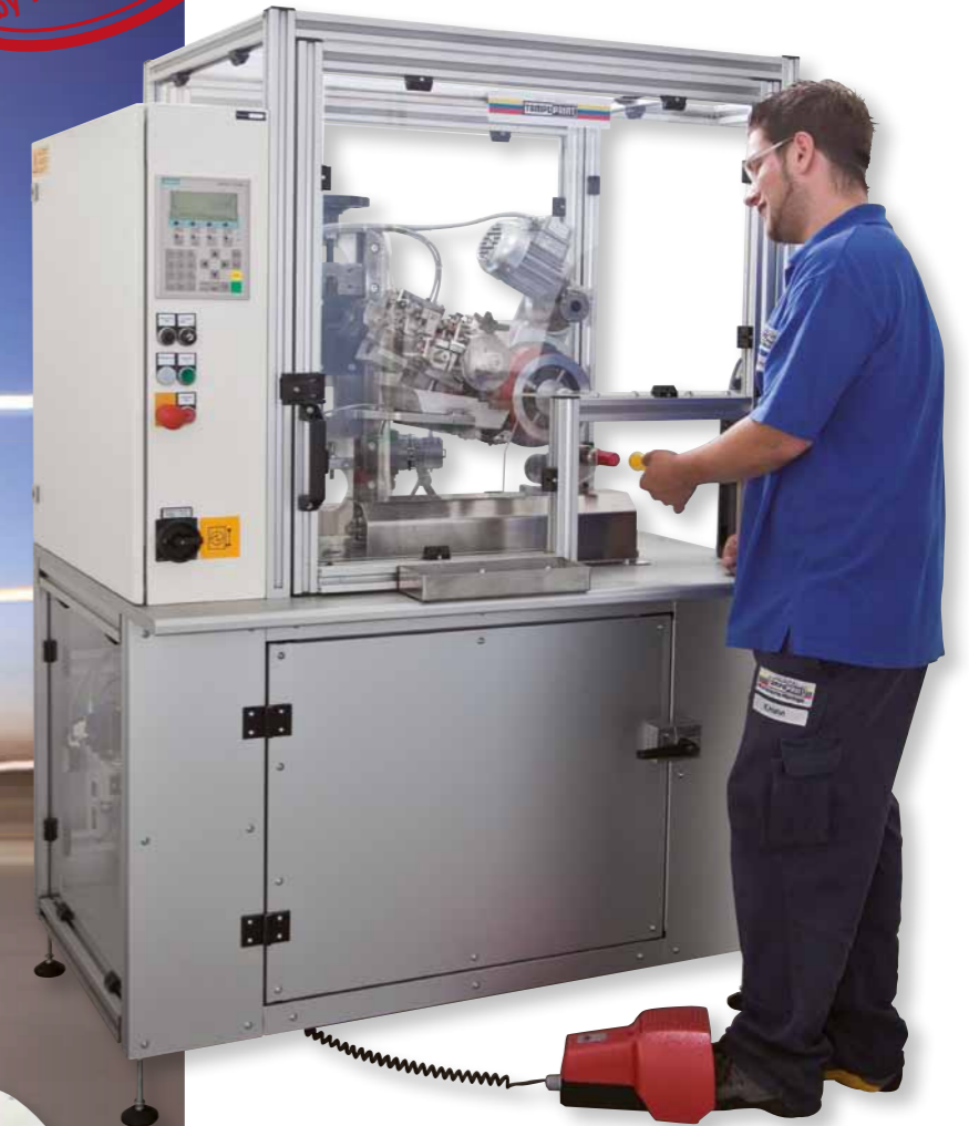
Abb.: Sonderausführung (Untergestell geschlossen)