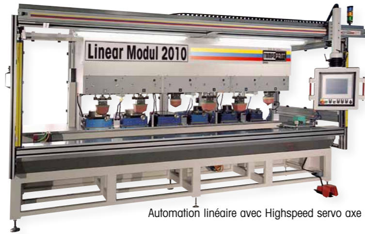
Automatisation linéaire avec Highspeed servo axe