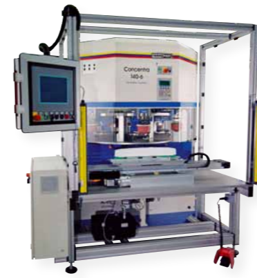
Reference "Concentra 140-6" Front de machine à laver