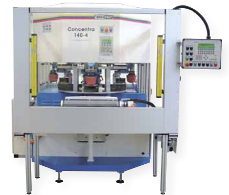
Reference "Concentra 140-4" Front de machine à laver