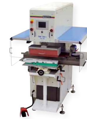
Reference "TSQ 130-1" Front de machine à laver