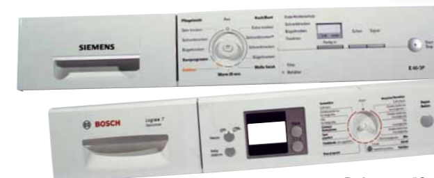
Reference "Concentra 140-6" Front de machine à laver