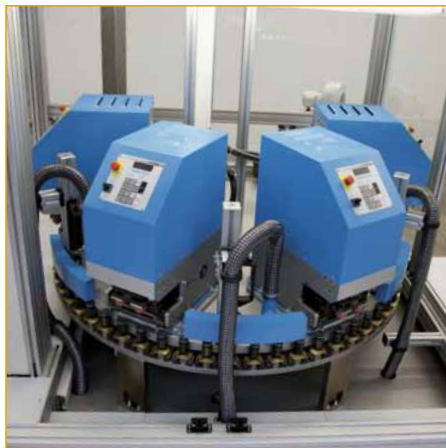
Ejemplo de combinación de una "TOP SPIN LC" (impresión circular) + "Speed Modul" (impresión en zona superior) imprimiendo en tapon es alargados.