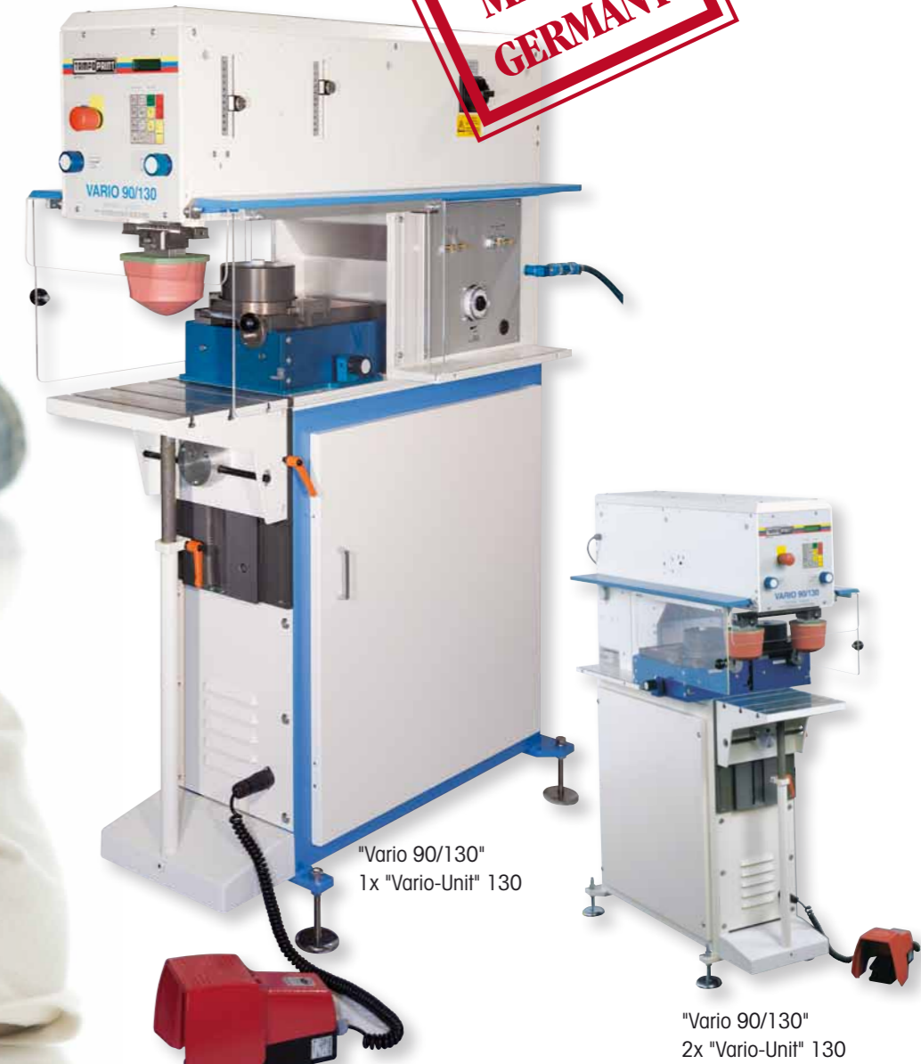
"Vario 90/130" 1x "Vario-Unit" 130