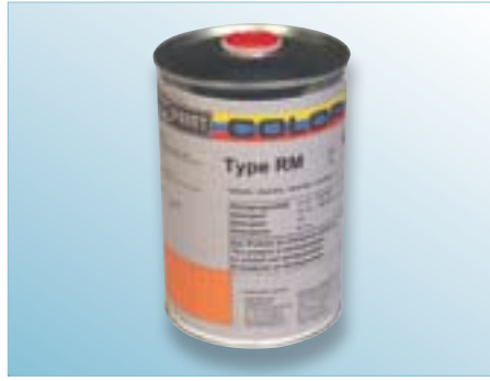
Abbildung: "RM" Reinigungsmittel Flammpunkt >100°C