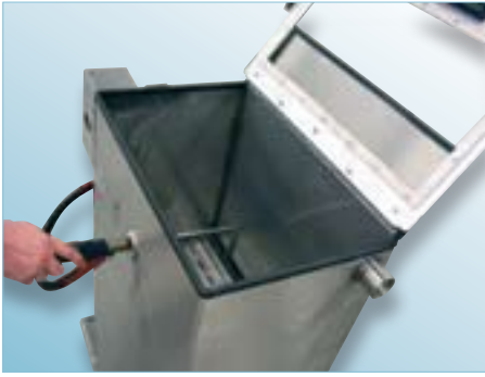
Abbildung: Aufsicht mit drehbarem Sprühstab