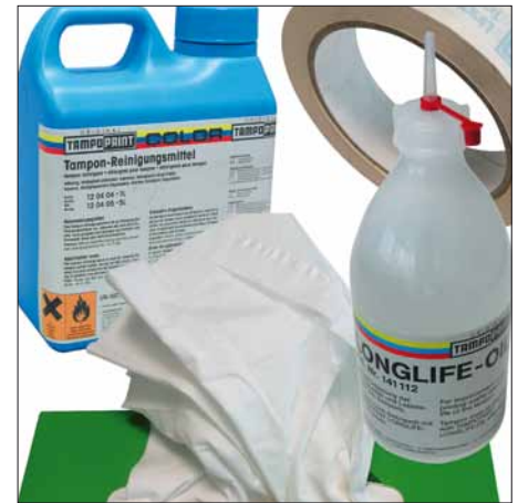
Abbildung: Verbrauchsmaterial für die Tampon-Pflege