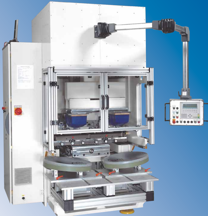
Abb.: TS 450/41 Referenzmaschine 2-Farben-Ausführung Bedrucken von Satellitenschüsseln